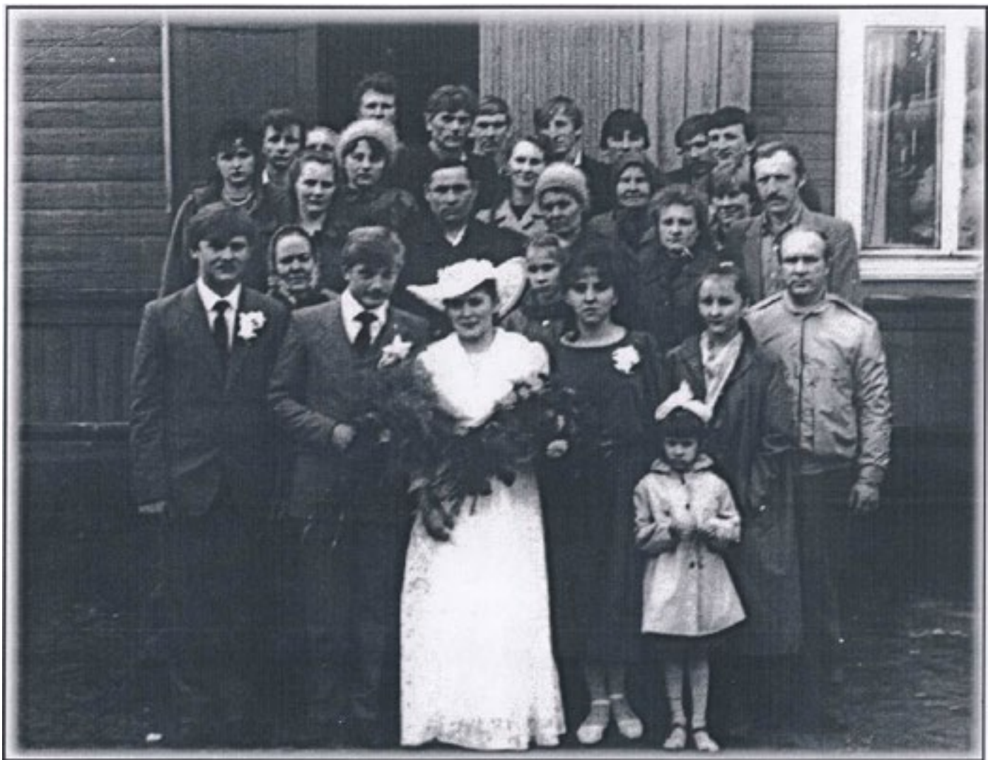
Торжественная регистрация брака в помещении Ельненского клуба, октябрь 1988 г.