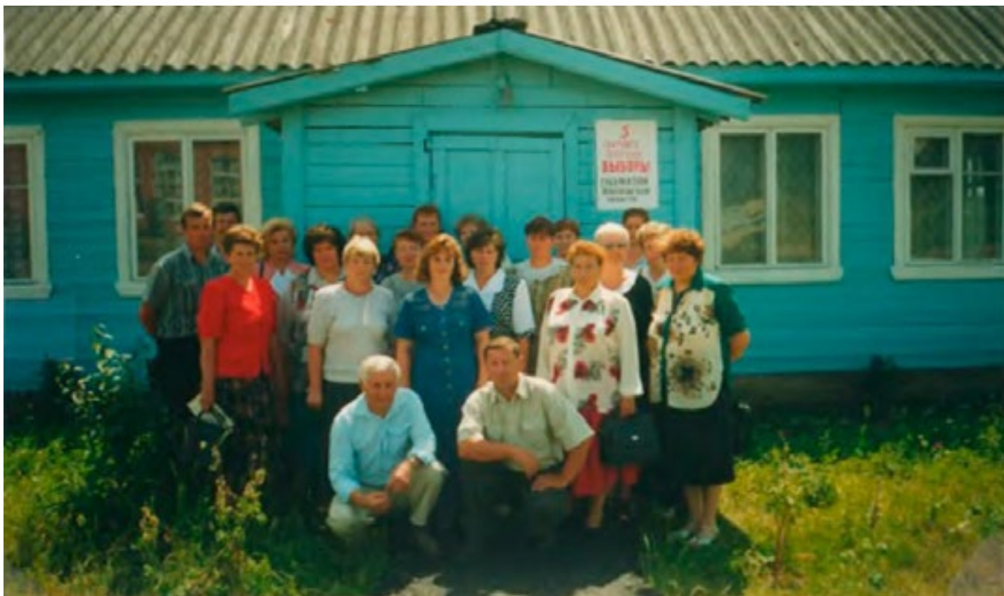
1999 год. Главы сельских Администраций на районном семинаре в Тухомической сельской администрации. (Фото на фоне здания Администрации в д. Тухомичи)